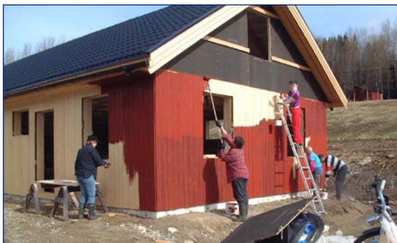
Nybyggande i kommunen signalerar framtidstro.

Åsele kommun har, under de senaste 50 åren, upplevt och upplever fortfarande en kraftig befolkningsminskning. Under 60- och 70-talet berodde denna minskning i första hand på utflyttning, men allt eftersom befolkningen åldrats har minskningen istället kommit att bero främst på att för få barn föds; unga söker utbildning på annan ort och återvänder inte då det saknas arbetstillfällen. All inflyttning är därför av stort värde för kommunen och varje välplanerad nyetablering för permanent boende kan ses som ett steg i rätt riktning, eller t.o.m. avgörande, ur ett långsiktigt perspektiv. Inflyttning och nybyggande signalerar framtidstro och bidrar till starkare underlag för näringslivet samt för upprätthållande och utveckling av infrastruktur och samhällsservice.