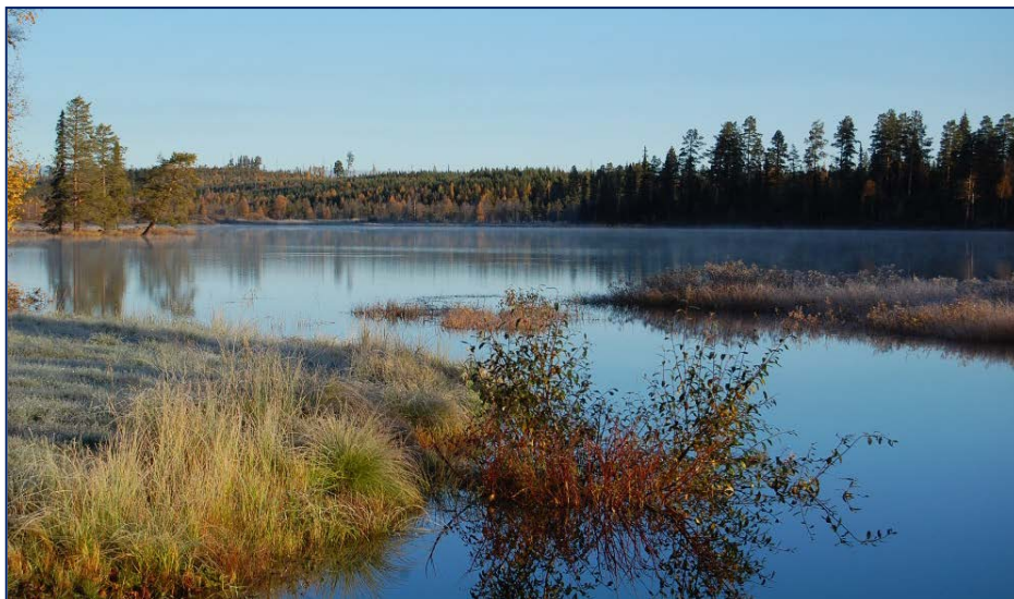
Vattenförande element i Åsele kommun.

Länsstyrelsernas avgränsningar från 1979 strider i praktiken mot den nya lagstiftningen från 2009 eftersom den senare inte redovisar någon precisering av vad ett vattendrag, strand- eller vattenområde är. Enligt nuvarande lagstiftning gäller att samtliga stränder, vattendrag och vattenområden omfattas av strandskyddsbestämmelserna oavsett storlek och läge. Förändringar är att vänta gällande dessa två motstridiga föreskrifter inom de närmaste åren. Till dess kan beslutsfattaren dock betrakta länsstyrelsens avgränsningar som gällande.