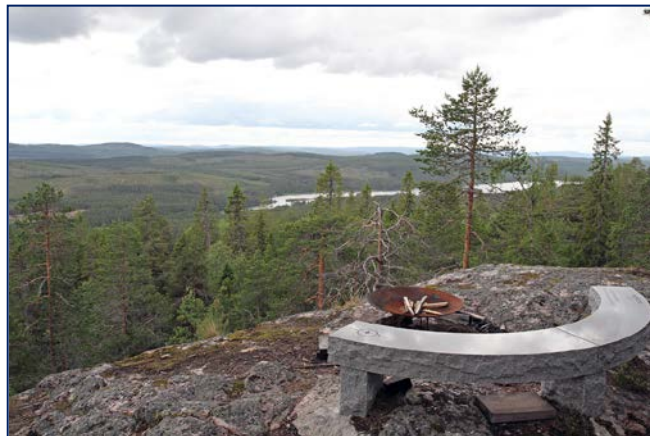
Ekopark Kåringberget.